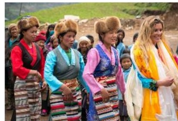
Festa de recepção dos brasileiros em Pattle em Nepal - Autor: Andrei Polessi