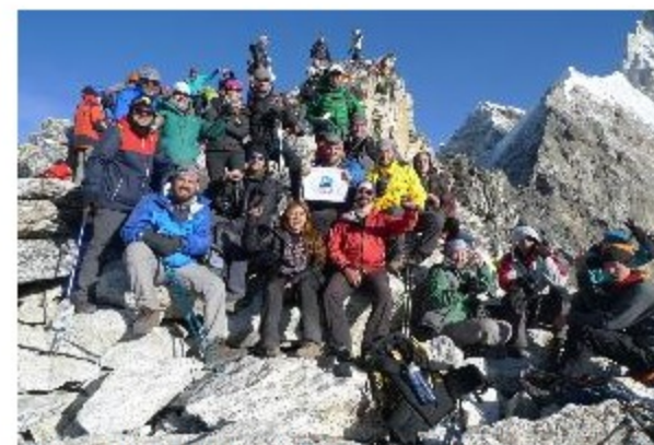
Grupo que fez parte do Trekking solidário ao Everest no cume do Kata Pattar - Autor: Pedro Hauck