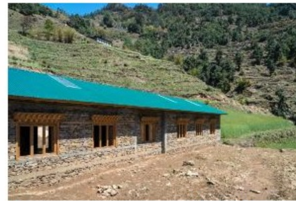
Escola construída com recursos do Projeto Dharma no Nepal - Autor: Andrei Polessi