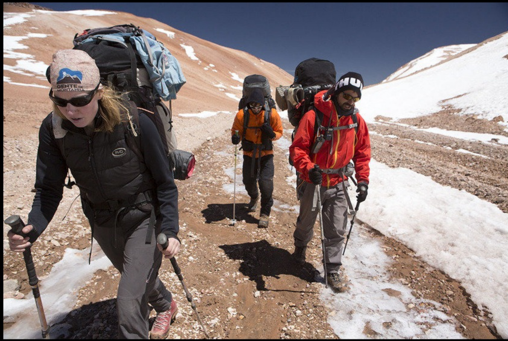
À esquerda, a cientista inglesa Suzie Imber caminha rumo ao topo do vulcão Copiapó