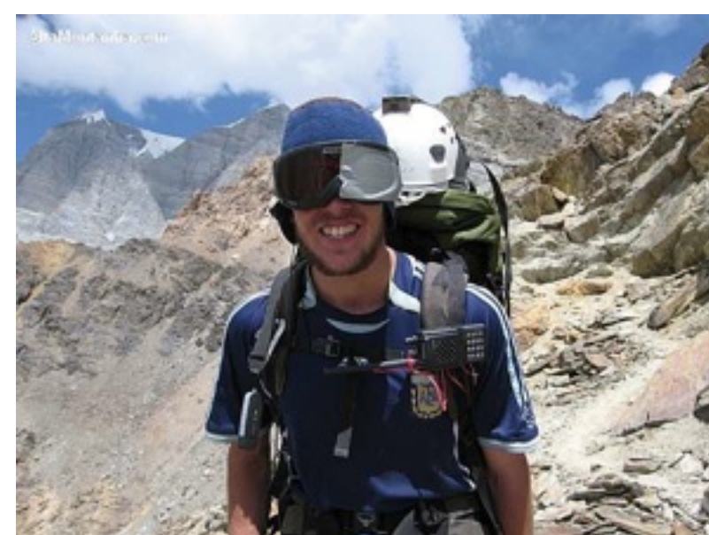
No Tadjiquistão em 2006 quando perdeu parte da visão