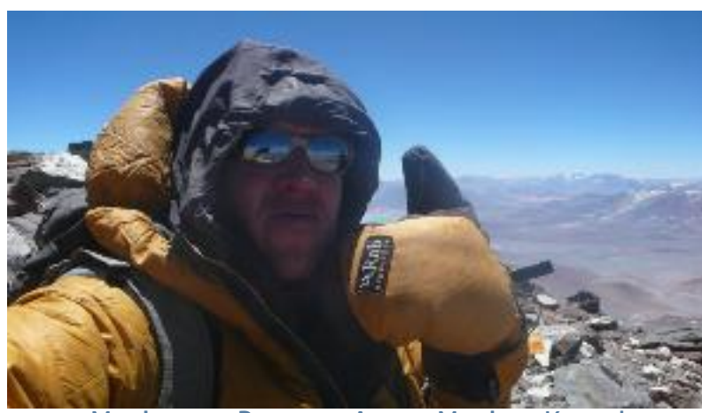
Maximo no Bonete - Autor: Maximo Kausch