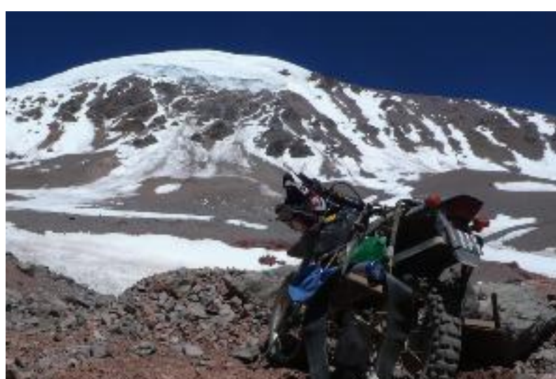
A parede nordeste do Olivares - Autor: Maximo Kausch