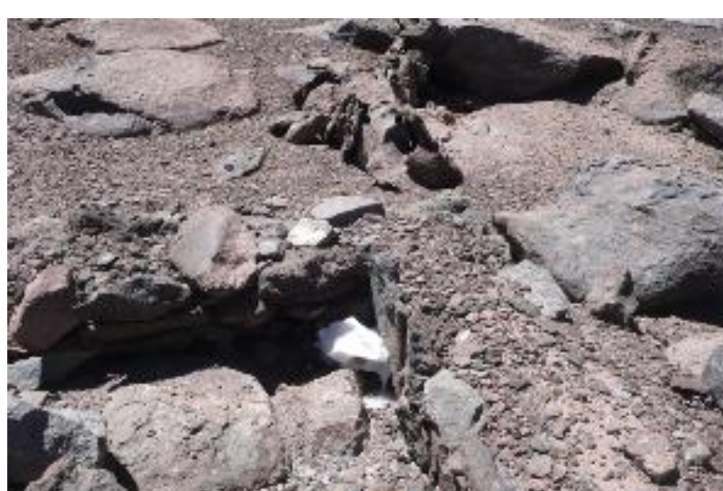
Construção inca no Veladero - Autor: Maximo Kausch