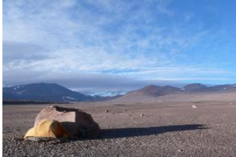
Solidão há 5500m - Autor: Maximo Kausch