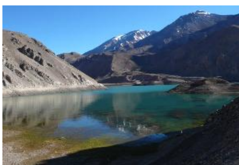
Caminho à Argentina - Autor: Maximo Kausch