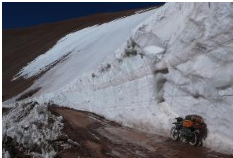
Paso Agua Negra com 4700m - Autor: Maximo Kausch