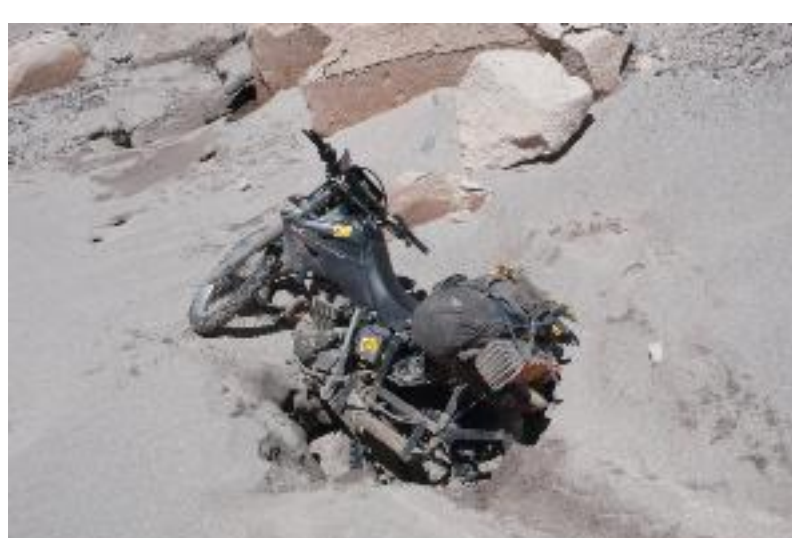
Moto de Maximo afundada numa greta