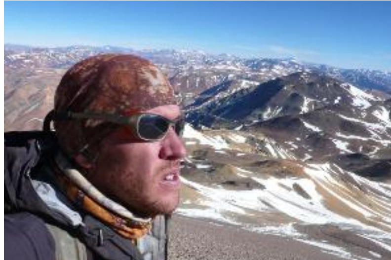
Maximo no Tórtolas - Autor: Maximo Kausch