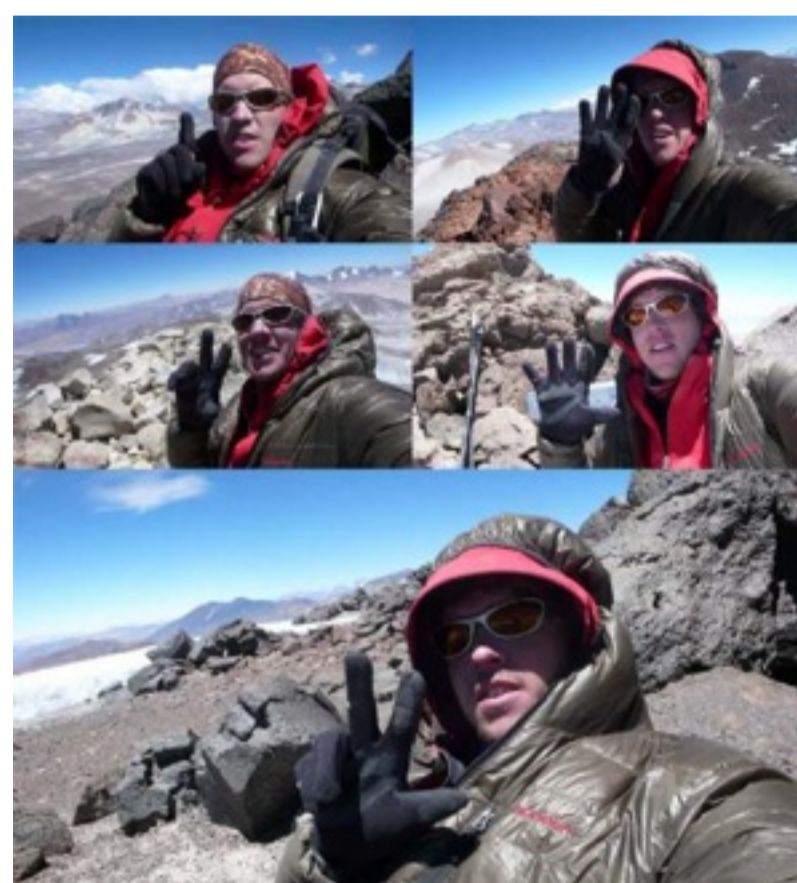
Maximo Kausch e os 5 cumes - Autor: Maximo Kausch