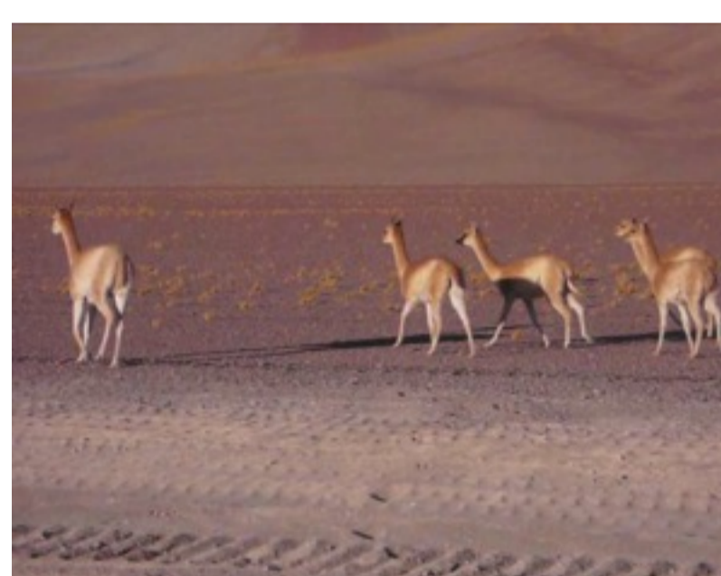
Vicuñas na estrada