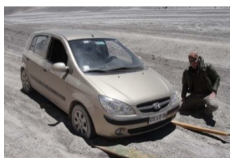
Usando tábuas como ponte na areia - Autor: Fabio Dellalio