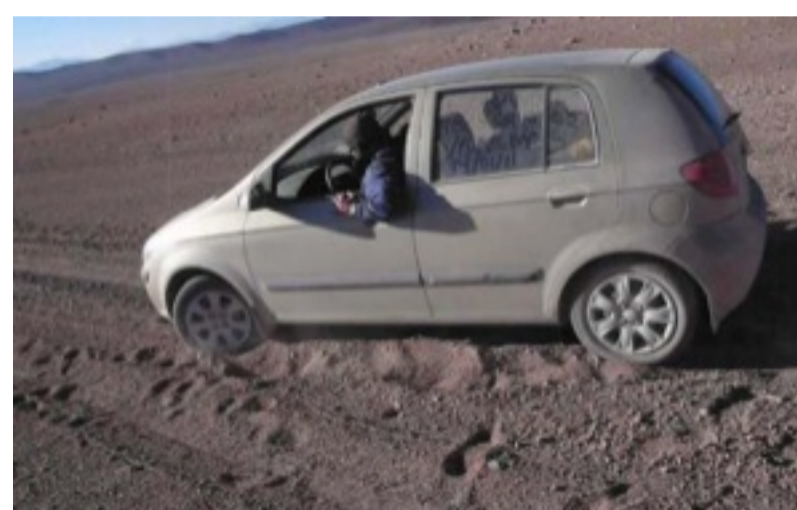
Desatolando o carro a 5000m de altitude