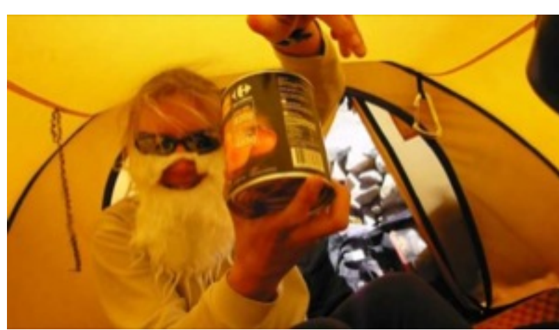
Presente de Natal: Comida deixada por outras expedições!