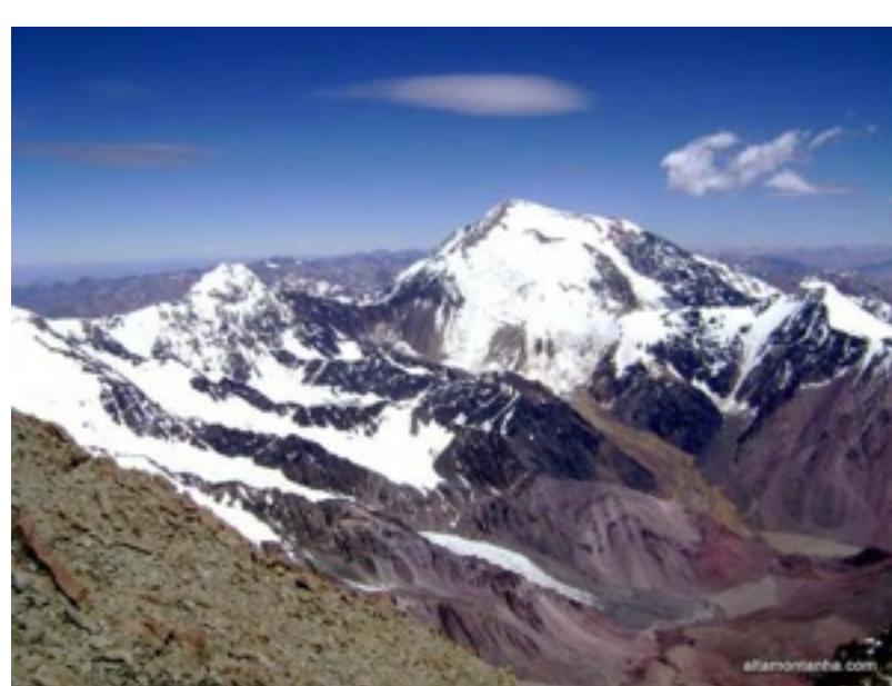
O Cerro Mercedário visto do cume do Ramada