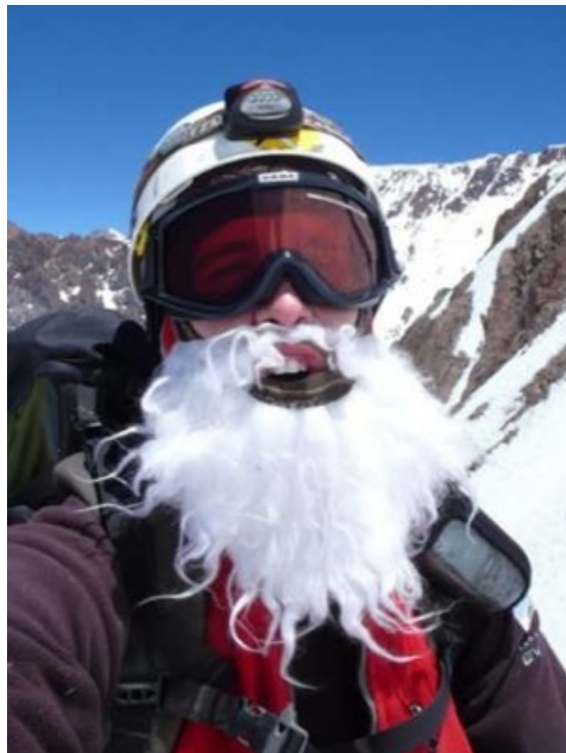
Escalando durante o dia de Natal