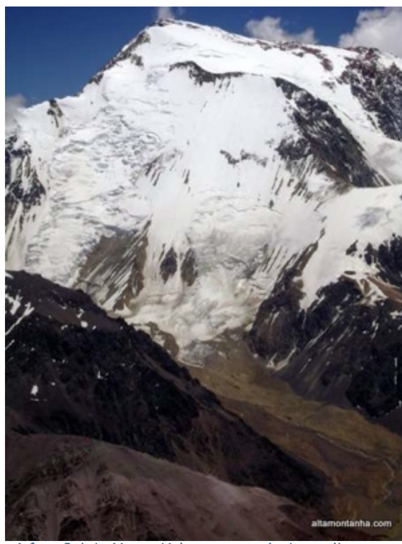
A face Sul do Mercedário e seus mais de 2 mil metros de altura - Autor: Pedro Hauck